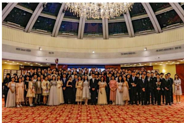
统计学院新生舞会合影

舞会伊始，一首《目不转睛》点燃了全场的气氛。正如歌词“我正在看着你看着你，目不转睛”，她颌首，微笑；他上前，注目，彼此初见的羞涩中流露出相遇的喜悦。尚未熟识的拘束和不知所措在第一支舞中慢慢散去。第一支舞过后，踩气球游戏给男生们提供了一次在舞伴面前展现自己的机会。在“砰砰”气球爆炸声中，有人为舞伴成功赢得礼品而喜悦，有人为得到舞伴的鼓励而欢喜。这场游戏没有输赢，只有彼此的友谊在欢笑声中渐渐升温。