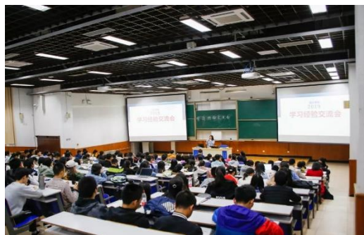
学习经验交流会现场

通过此次学习经验交流会,2019级本科新生对自己的大学生活有了更深入的了解和更明晰的规划,相信2019级本科生会度过难忘而充实的四年时光。