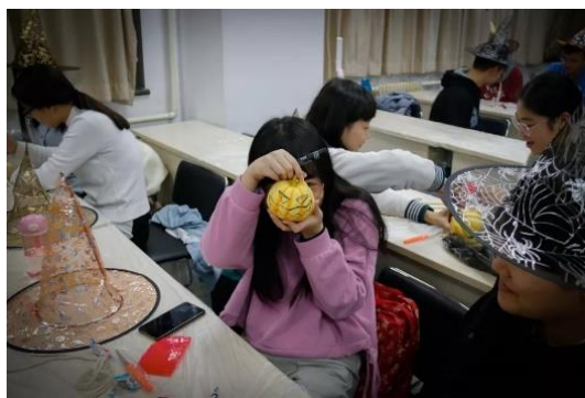
雕刻南瓜灯活动现场

“一二·九”合唱的排练既让同学们在此过程中收获了快乐，培养了团队精神，又让他们感受到了爱国主义情怀的熏陶，期待统计学院在即将到来的“一二·九”合唱比赛中再创佳绩！