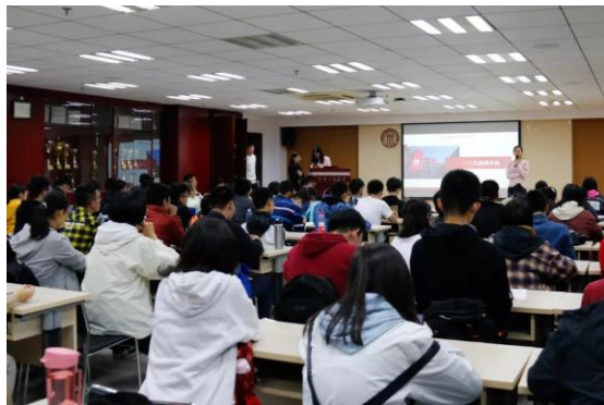
“一二·九”合唱比赛动员大会现场

大会开始，同学们集体观看了2017年、2018年“一二·九”合唱比赛的视频，大家都被合唱同学呈现出的良好精神风貌与精彩的演唱深深吸引。