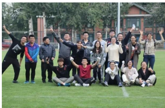
拔河比赛成员合影

统计学院首先迎战数学学院。比赛开局后双方保持均势，在接近20秒的胶着后统计学院逐步扩大优势，在对方的发力空挡成功打破平衡，战胜了数学学院。