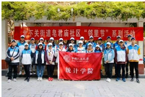
街道志愿活动参与志愿者合影

本报讯 10月26日上午，统计学院的志愿者们来到了北下关街道皂君庙公共文化活动室，与社区居民们一同开展趣味运动会。纵然寒风瑟瑟，也依旧无法阻挡大家的热情与活力。活动时间不长，却绘出了邻里之间的和谐，道出了人与人之间的温情。