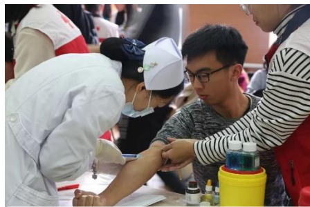
无偿献血活动现场

11月10日上午，统计学院的同学们在工作人员的带领下，来到中国人民大学学生活动中心进行无偿献血活动。秋的寒气肆意席卷着校园，但志愿者们带着爱心，温暖了这个寒秋。