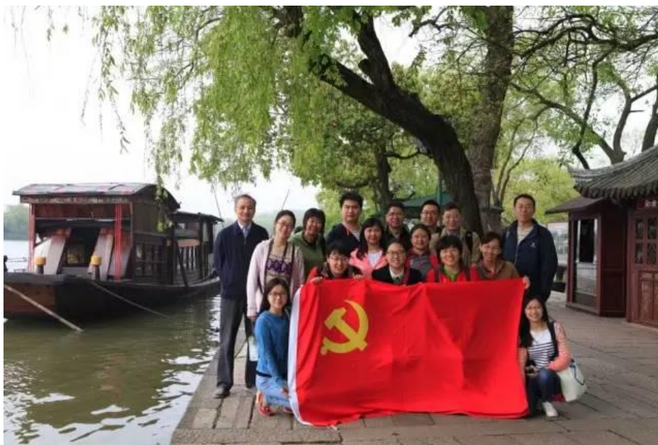
共产党员在一大会址——南湖红船旁合影

教师党员参观了中国共产党的诞生纪念地——嘉兴南湖中共一大会议址红船。1921年7月，中国共产党第一次全国代表大会在上海望志路秘密召开，会议中途因遭法租界巡捕的袭扰搜查，后期转移到嘉兴南湖，在南湖的一条游船上继续举行。包括毛泽东、董必武在内的十二名代表在游船上讨论通过了中国共产党的第一个纲领和第一个决议，选举了党的中央领导机构，宣告中国共产党成立。