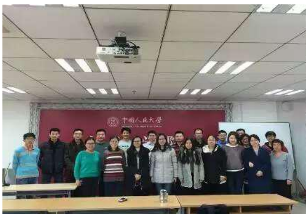
主讲教授与同学们合影