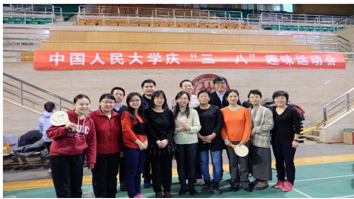
参与运动会的老师们的合影

本报讯 3月2日中午一时，在世纪馆羽毛球场地，中国人民大学庆祝“三八”国际妇女节教职工趣味运动会在热烈欢快的氛围中开始。