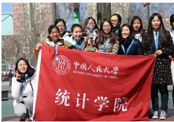
我院女排队员在颁奖后合影

在前三场比赛中，统计学院势如破竹，一局未失。半决赛当日寒风凛冽，也不能冷却队员的热血和观众的热情。统院女排在排乙比赛中一路高歌，直冲决赛。3月9日的排球场，在前两局一胜一负的情况下，决赛第三局的比赛格外激烈。我方主力队员生病缺席，全队有些力不从心，最终以12:15的3分之差，惜败信息学院。