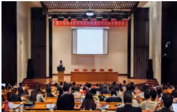
研讨会在国学馆报告厅隆重召开

本报讯 12月17日,“第十届临床医学研究中的统计方法学术研讨会-大数据背景下的传承与创新”在中国人民大学国学馆报告厅隆重召开。本届研讨会由中国人民大学应用统计科学研究中心、北京生物医学统计与数据管理研究会、首都医科大学北京市临床流行病学重点实验室、中国现场统计研究会生物统计分会和国际生物统计学会中国分会共同主办,来自各高校、医院和企业界的180余位专家学者和学生代表参加了研讨会。